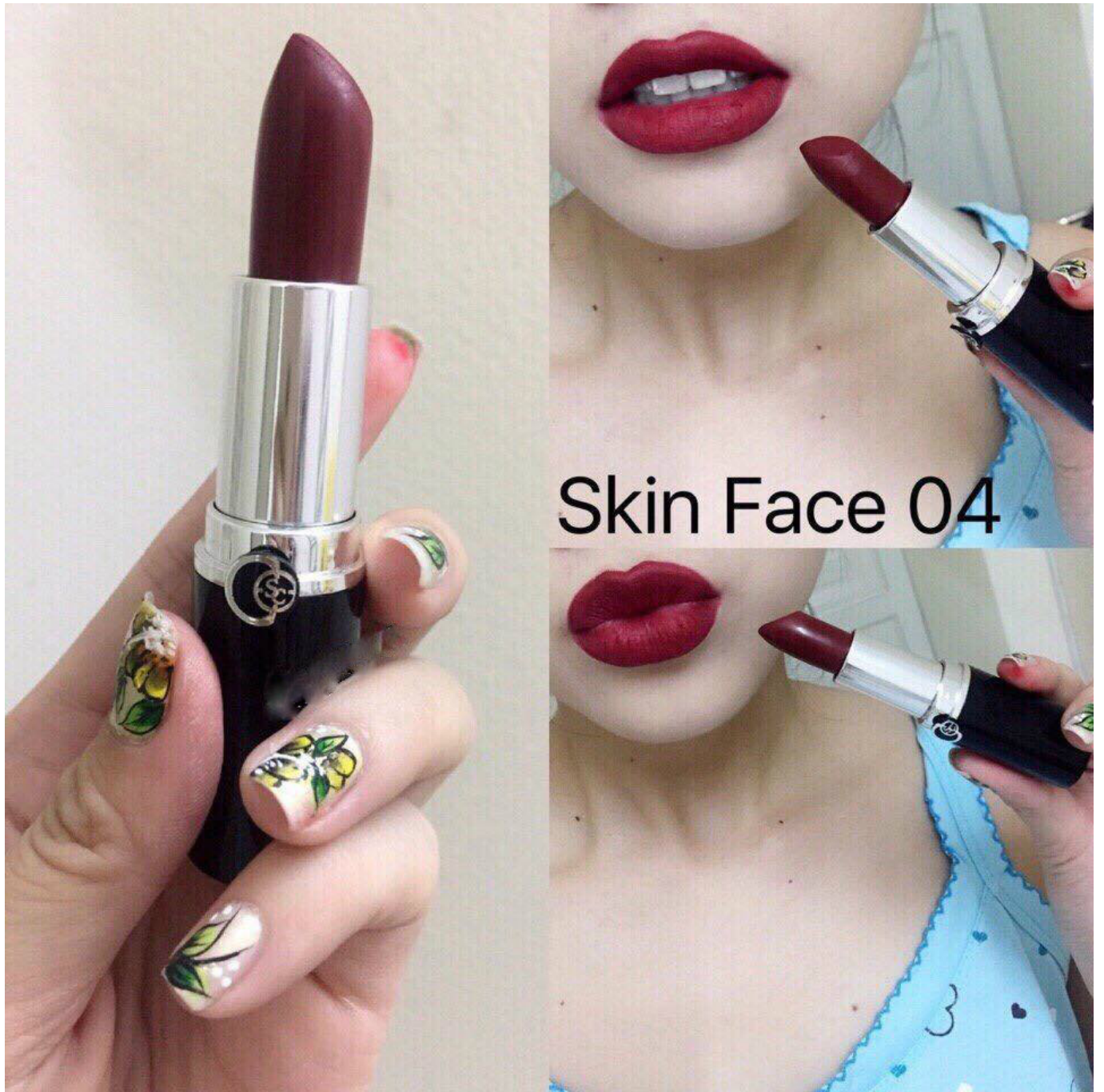
#04 Luxury VRIT: Màu đỏ trầm rượu vang quý phái.