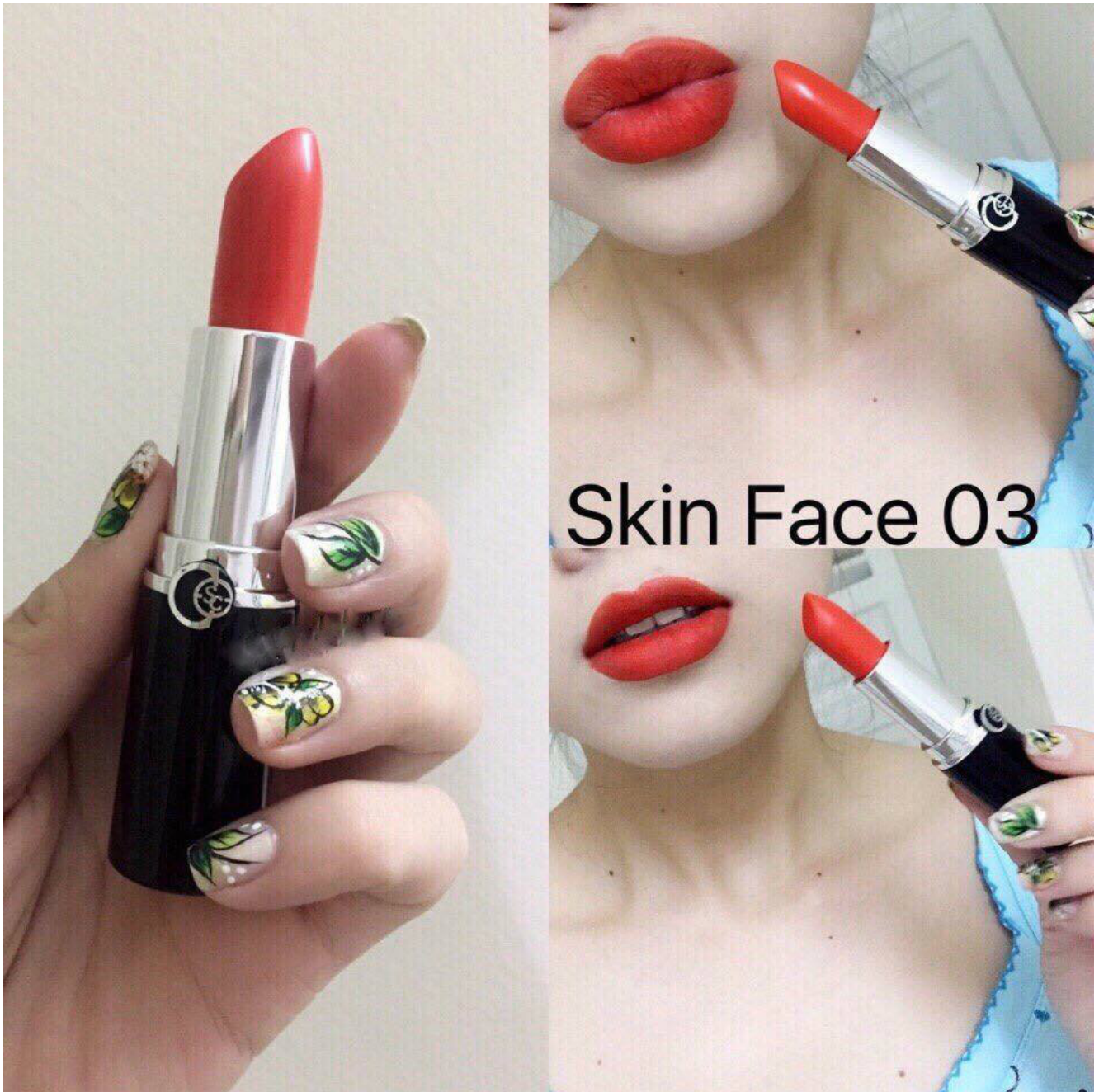
#03 Luxury Or: Cam tươi cho những bạn gái thích sự năng động, nhiệt huyết.