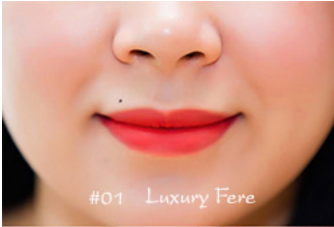
#01 Luxury Fere