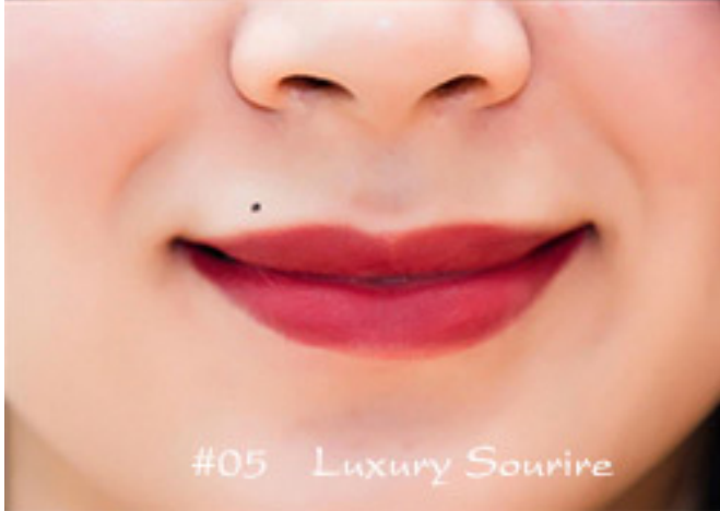
#05 Luxury Sourire