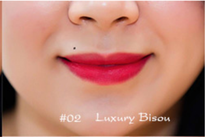
#02 Luxury Bisou