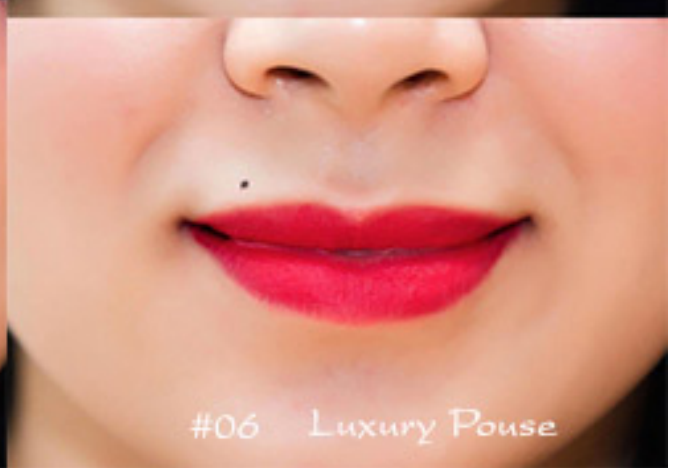
#06 Luxury Pouse