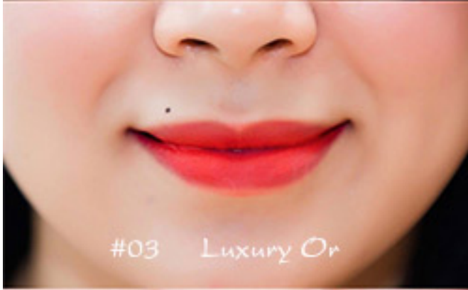
#03 Luxury Or