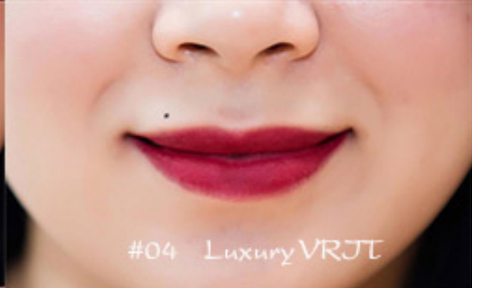
#04 Luxury VRJT