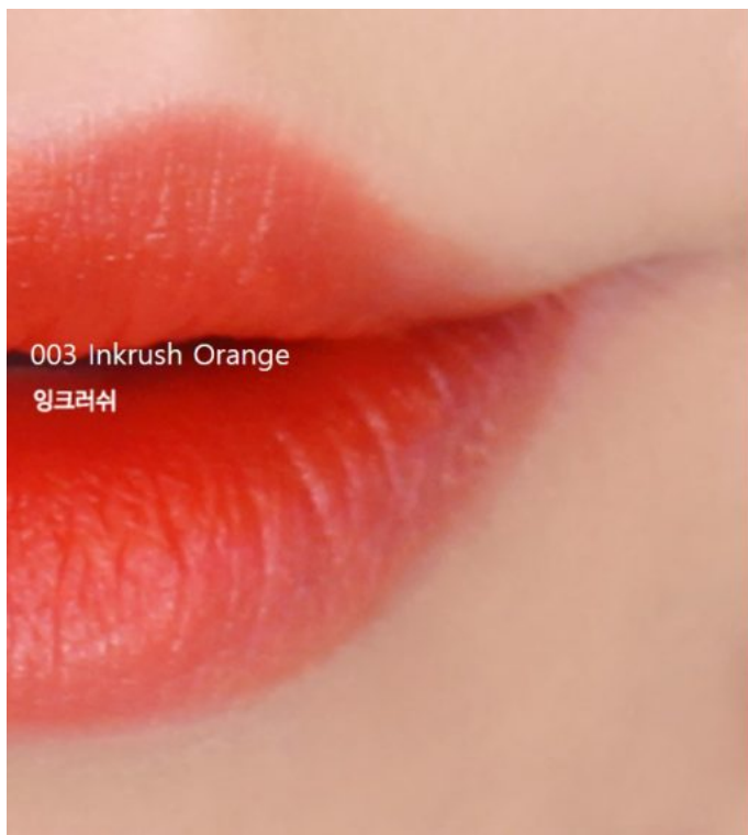
003 Inkrush Orange 잉크러쉬