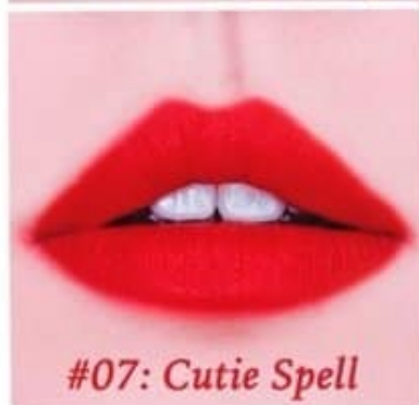
#07: Cutie Spell