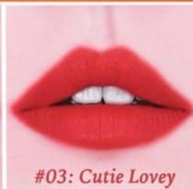
#03: Cutie Lovey