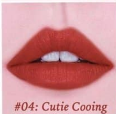
#04: Cutie Cooing