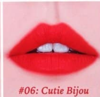
#06: Cutie Bijou