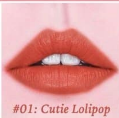
#01: Cutie Lolipop