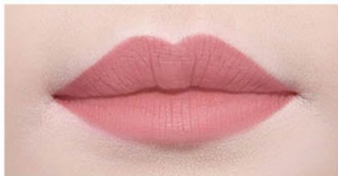
히든 센슈얼 HIDDEN SENSUAL