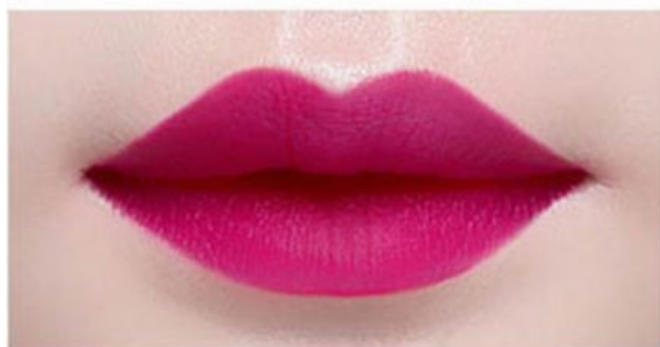
코드네임 CODE NAME