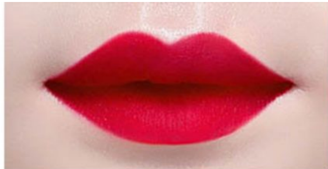
와일드 로즈 WILD ROSE