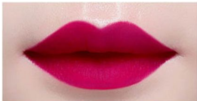
레디 블러디 READY BLOODY