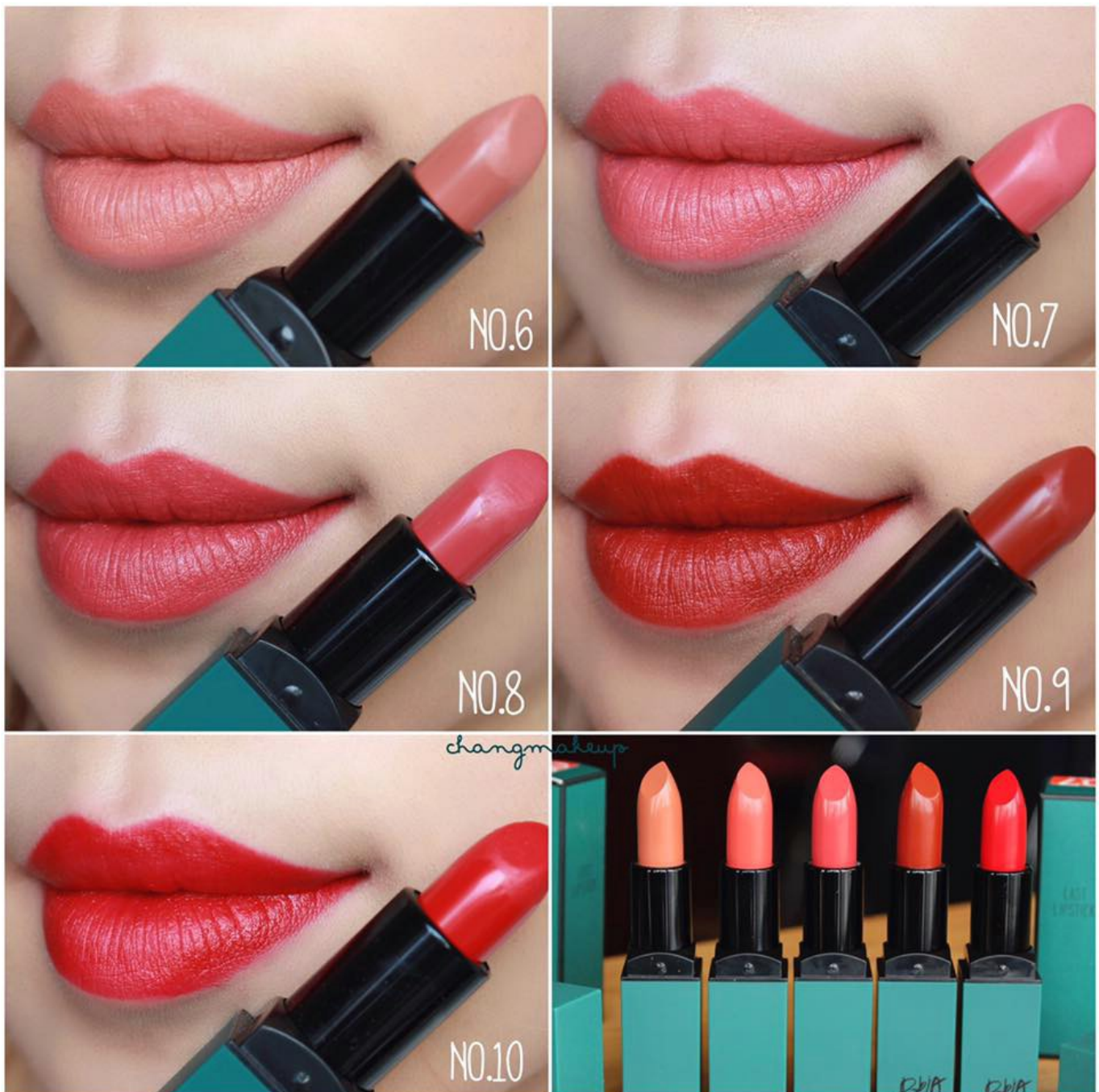
Bảng Màu Bbia Last Lipstick Green Series