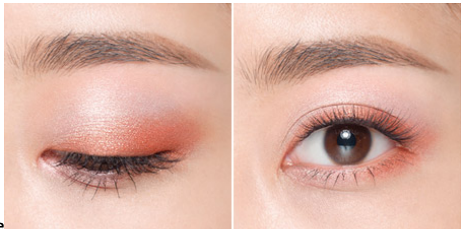
#No.02 : Golden Rose