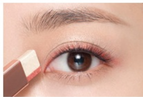
STEP 2. Eye gradation

Direct point color to eye lashes. Apply as if pushing from outer corner of eyes to inner corner.