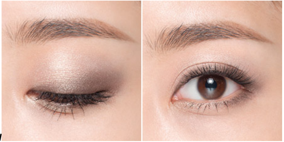
#No.03 : Orange Island