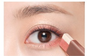
STEP 4. Natural shade

Apply base color till the 2/3 point from inner corner