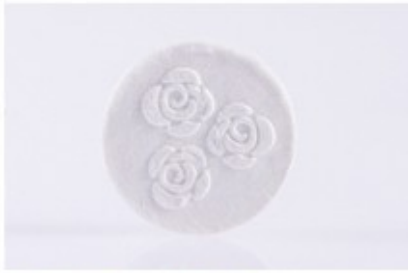
1. Bóc 1 viên nén mặt nạ