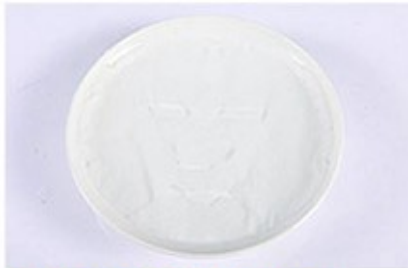
4. Viên nén đã lên hình mặt nạ