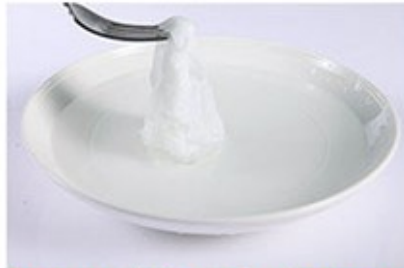
5. Giờ chỉ việc lấy nó lên và đắp mặt thôi