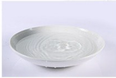
2. Thả vào dưỡng chất hoặc nước sạch