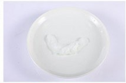
3. Đợi vài giây để viên nén bung ra